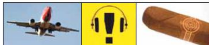
Get en rebus.